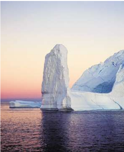
Die globale Erwärmung setzt den Eismassen am Nordpol zu